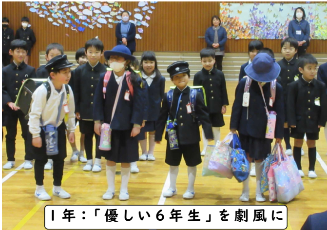
1年：「優しい6年生」を劇風に

2月27日に、児童会で考えたスローガン「感謝～ありがとういっぱいのにしよう」のもと、「6年生を送る会」を行いました。各学年が、お世話になった6年生に感謝を伝えようと一生懸命に出し物や呼びかけをする姿に、何度も熱いものがこみ上げてきました。5年生が6年生に「6年生の勢いをください。そのために一緒に踊ってください。」と頼み、一緒に踊ったソーラン節は感動的でした。会の計画・準備・進行を進めた5年生は、本校の新リーダーとして、頼もしい活躍ぶりでした。今日の日は、小学校生活のよい思い出として、6年生の心に残ることでしょう。