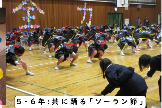
5・6年：共に踊る「ソーラン節」