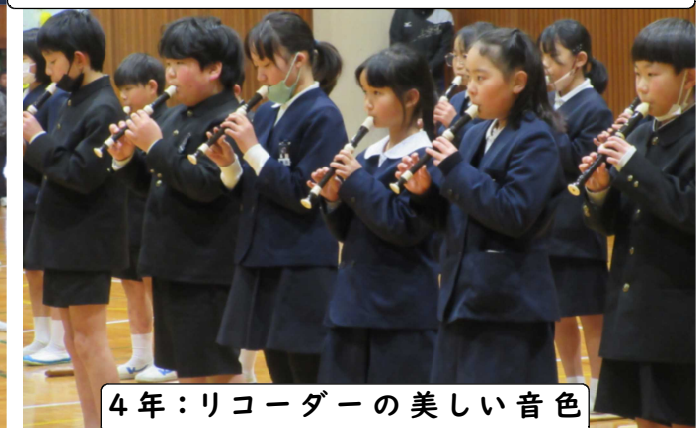
4年：リコーダーの美しい音色