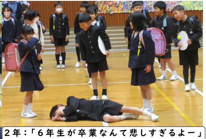
2年：「6年生が卒業なんて悲しすぎるよー」