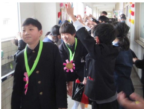
サプライズ!全校での花道