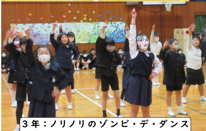
3年：ノリノリのゾンビ・デ・ダンス