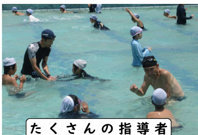
たくさんの指導者