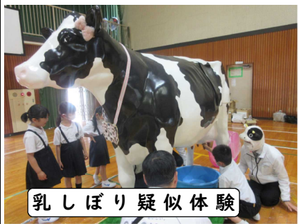
乳しぼり疑似体験

オハヨー乳業の方が来校し、牛乳についてのお話や乳しぼり体験をさせていただきました。おかげで、2年生はその日から牛乳をよく飲むようになったようです。