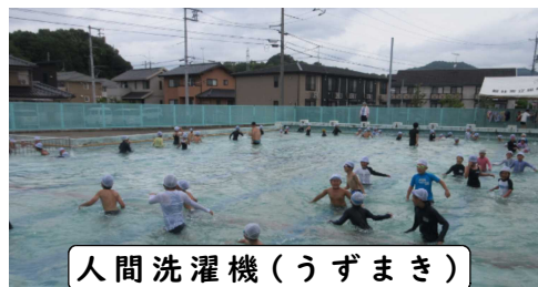
人間洗濯機(うずまき)