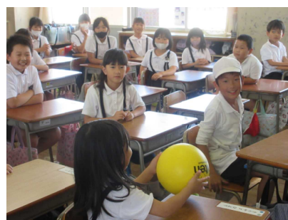
ドキドキ!爆弾ゲーム

6月16日に行われた第1回縦割り班遊びは、6年生が遊びの計画をし、進行しました。各班、工夫を凝らした遊びのおかげで、どの子も緊張気味の顔からニコニコ笑顔に変わっていきました。頼りになる6年生、ありがとうございます。これから仲良く助け合える班になっていくのが楽しみです。