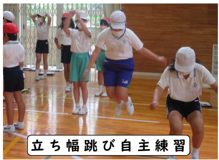
立ち幅跳び自主練習

6月9日に5年生が池田小学校へ行き、5・6年生11人と学校探検やスポーツテストなどで交流しました。池田小は自然豊かでした。9月の中央小での交流も楽しみです。